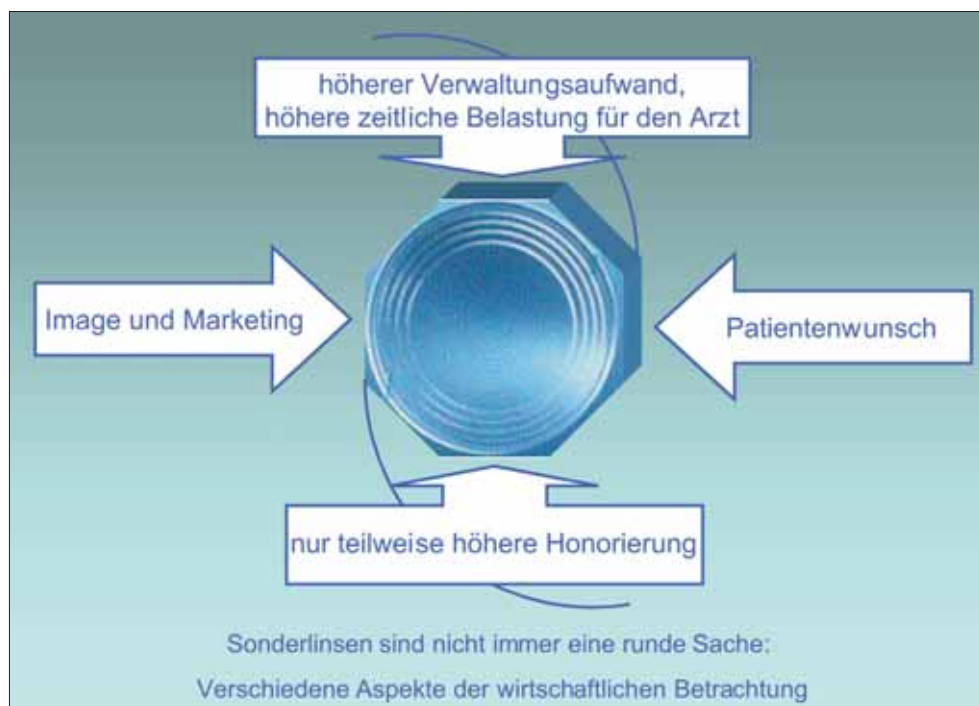
Die Implantation einer Sonder-IOL sollte stets aus mehreren betriebswirtschaftlichen Blickwinkeln betrachtet werden.

vorher beantragt und durch die Kasse genehmigt worden ist. Abweichend davon zahlen die Kassen in einzelnen Fällen nur das Operationshonorar und gegebenenfalls die Sachkosten ohne Linse. Alle anderen Fälle sind als IGEL mit dem Patienten selbst abzurechnen (d.h. Linse